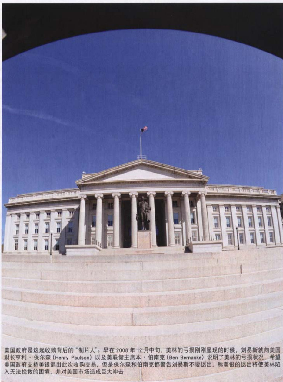
美国政府是这起收购背后的“制片人”。早在2008年12月中旬，美林的亏损刚刚显现的时候，刘易斯就向美国财长亨利·保尔森（Henry Paulson）以及美联储主席本·伯南克（Ben Bernanke）说明了美林的亏损状况，希望美国政府支持美银退出此次收购交易，但是保尔森和伯南克都警告刘易斯不要退出，称美银的退出将使美林陷入无法挽救的困境，并对美国市场造成巨大冲击

金，以此增加收购方收购成本。除协议中另有约定外，公司与高管签订的协议一般不会因经济环境的改变而改变。所以，尽管美林2008年亏损严重，但美林高管根据协议领取奖金的权利不应受到影响（与公司业绩挂钩的部分除外），尽管从道德上说，他们似乎不应该，就当下的经济状况而言也不合时宜。