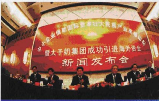
短短一年间，太子奶从天堂落入地狱，对赌因此而备受指责。

太子奶因对赌协议而易主，除了管理层对市场风险的忽略，还有一个重要的原因就是—直存在的行业风险。三聚氰胺对奶制品行业的打击并不仅仅证明只有奶制品行业才存在行业风险，其他如运输、能源、IT等行业都存在其固有